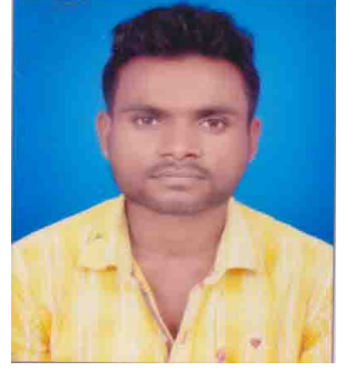
Photo & Specimen Signature of the Candidate