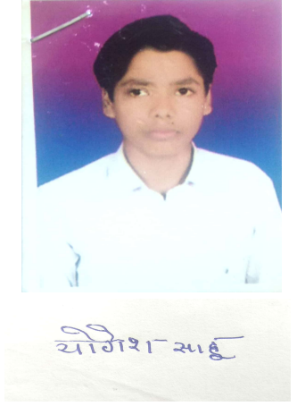
Photo & Specimen Signature of the Candidate