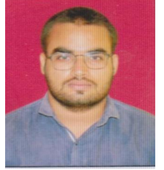
Photo & Specimen Signature of the Candidate