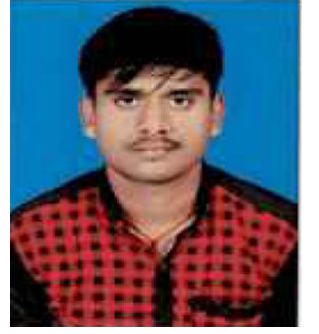
Photo & Specimen Signature of the Candidate